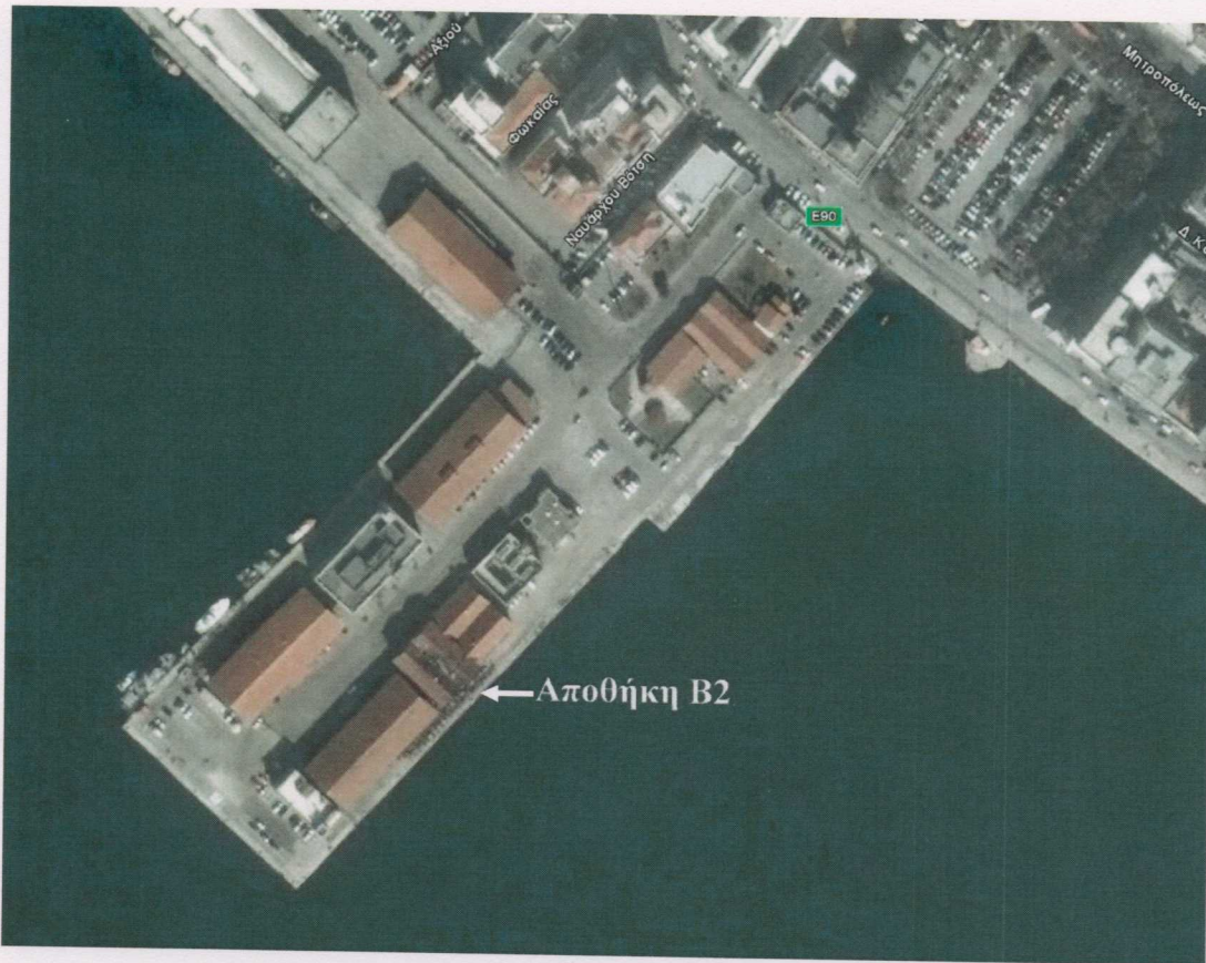
Φωτογραφία 1: 1 ος Προβλήτας ΟΛΘ – Θέση Αποθήκης Β2