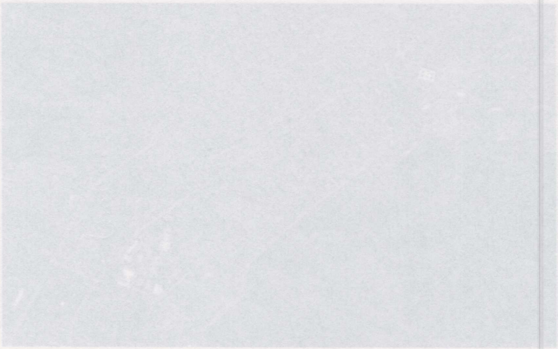
Φωτογραφία 2: Περιοχή Λιμένα – Κέντρο Θεσσαλονίκης - Παλιά Παναγία