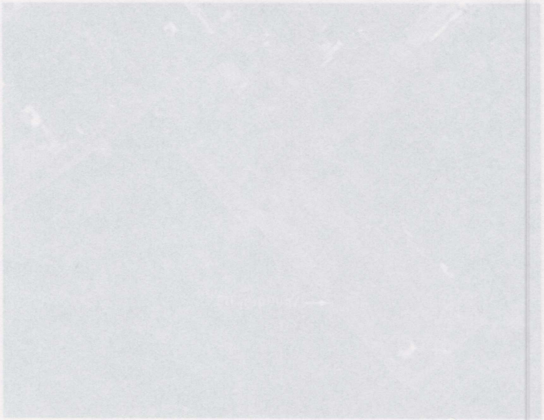
Φωτογραφία 1: 1 ος Προβληματικός ΟΛΘ – Έσση Αναθήκης ΣΣ