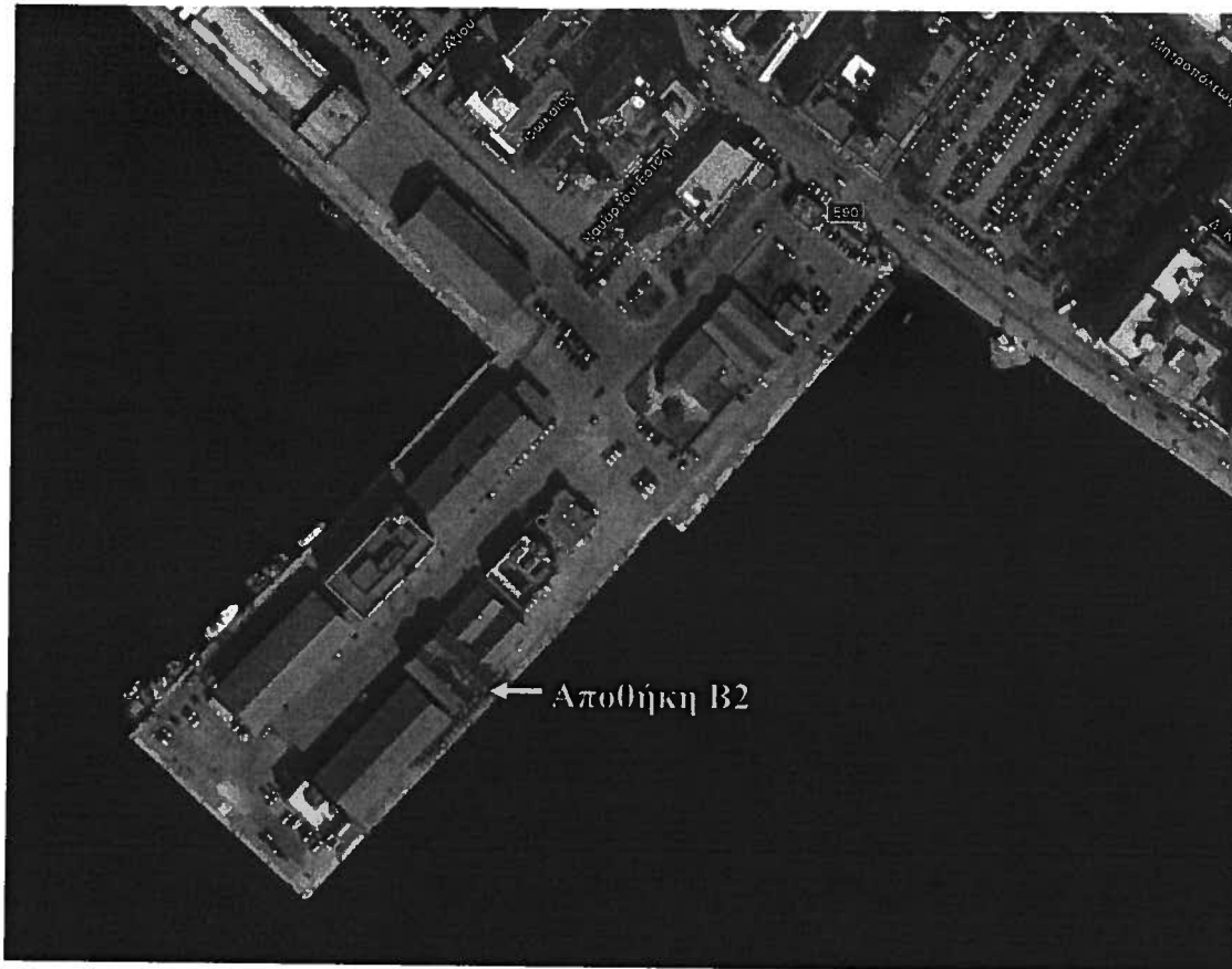
Φωτογραφία 1: 1 ος Προβλήτας ΟΛΘ – Θέση Αποθήκης Β2