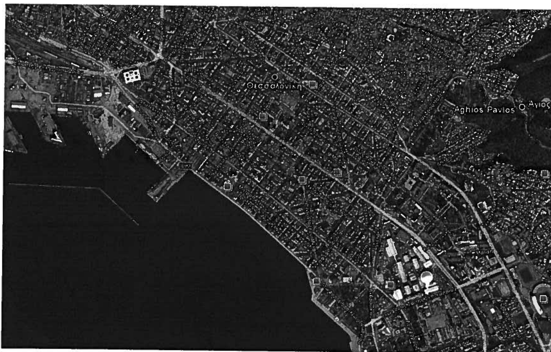
Φωτογραφία 2: Περιοχή Λιμένα – Κέντρο Θεσσαλονίκης - Παλιά Παραλία